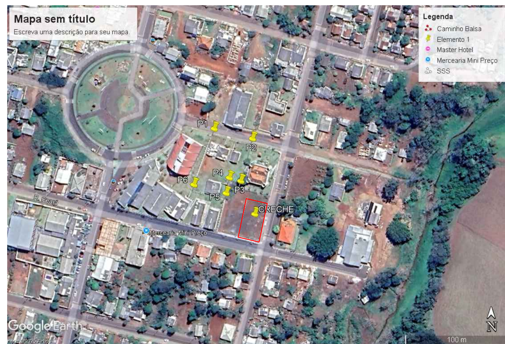
IMAGEM GOOGLE EARTH Sem Escala